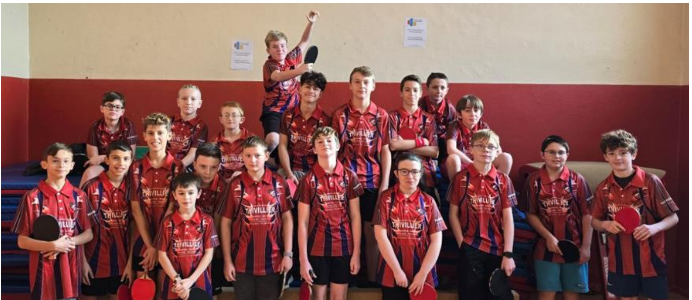
Effectifs jeunes du club de Souzy sur la plateau de L'Arbresle

Notre effectif jeune a commencé la compétition et lors du dernier plateau qui s'est déroulé à L'Arbresle, notre club a présenté 9 équipes. Le niveau global de ce plateau était assez relevé. Les résultats sont satisfaisants avec un maintien de notre équipe 1 en poule A (plus haut niveau) et l'ascension de l'équipe Souzy 8 au niveau supérieur. A noter les belles 2 ème place de Souzy 3 et Souzy 7, dans leurs poules respectives.